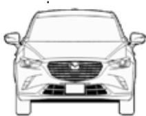
Ancho 2049 MM