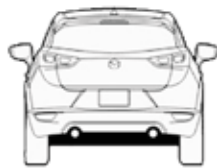
Alto 1545 MM